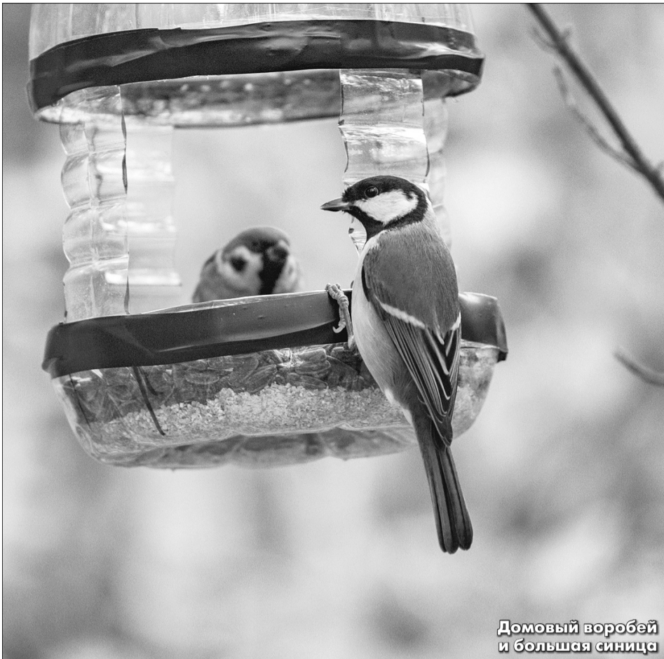
Домовый воробей и большая синица