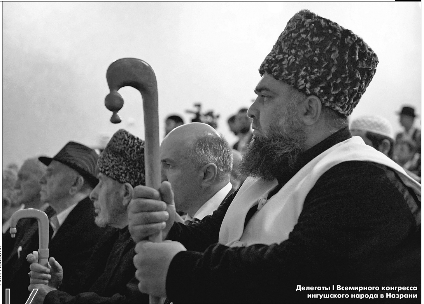
Делегаты I Всемирного конгресса ингушского народа в Назрани

Протестующие на площади истолковали слова Матовникова однозначно: федеральные чиновники не хотят решать вопрос и обвиняют самих жителей республики. Мол, если ваша власть так с вами поступает, значит, вы этого заслужили.