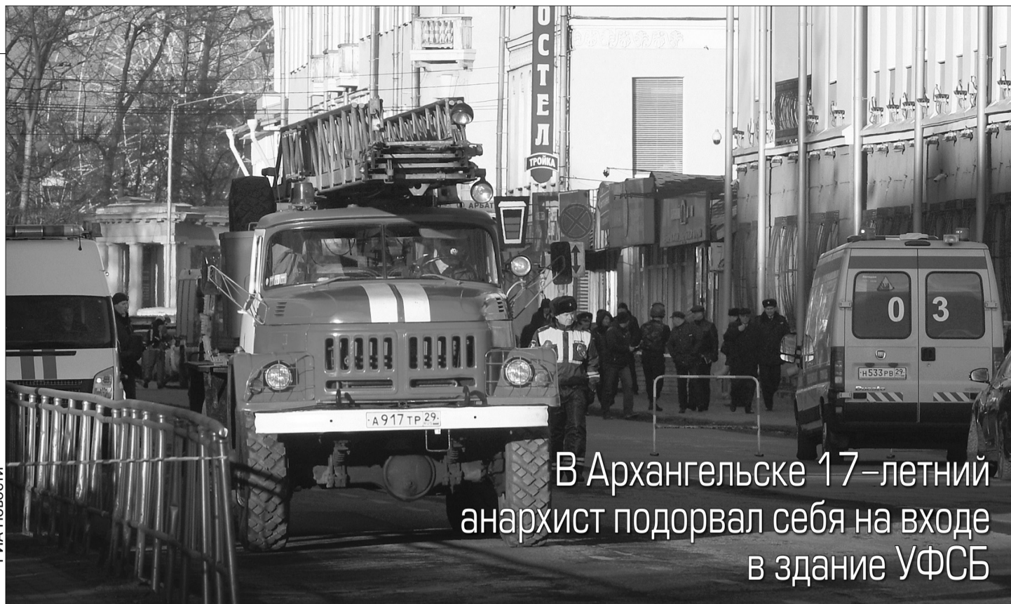
В Архангельске 17-летний анархист подорвал себя на входе в здание УФСБ

И делает это не из праздного любопытства, и не хайпа ради, а аккуратно как народовольцы — ради протеста против несправедливости. В его записке есть четкое указание причины: пытки и фабрикация уголовных дел, в которых он обвиняет именно ФСБ. Потому и пошел в «контору» с бомбой в сумке, как Вера Засулич с револьвером к градоначальнику Трепову, выпорывшему заключенного. Правда, трое посеченных осколками архангельских чекистов вряд ли имели прямое отношение к пыткам, о которых