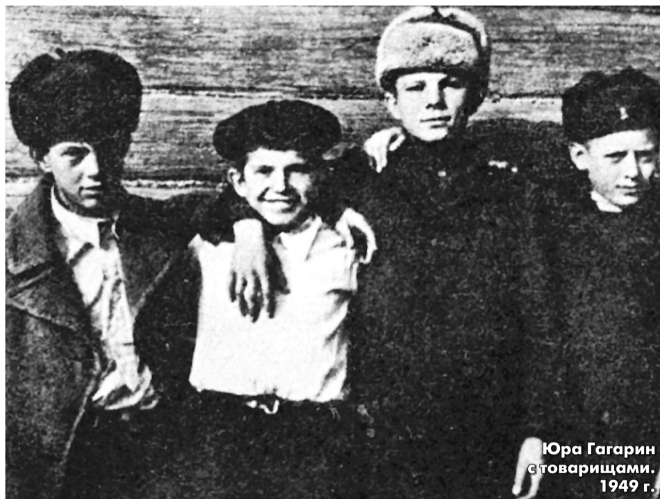
Юра Гагарин с товарищами. 1949 г.

Главный персонаж Пьесы Планеты Гагарин выступает как узловой ее элемент, вокруг которого организуется фабула и сюжет, т.е. у него появляется роль. Эта роль с 1961 года становится сложной и многомерной, ее трудно осознать, почувствовать, еще сложнее описать. Первый космонавт интегрирован в систему других героев и не может быть понят без них. Искусство — отражение стремления человека к достижению все новых и новых высот и глубин познания самого себя. А это означает, что тому, кто возьмется написать эпохальный роман о Пьесе Планеты, о Гагарине, придется охватить многие тысячи характеров (в «Войне и мире» 559 действующих лиц), которые вознесли Гагарина на вершину славы, и одновременно показать богатство своего внутреннего мира. Давно опубликованы поименные списки всех участников запуска корабля Гагарина, награжденных