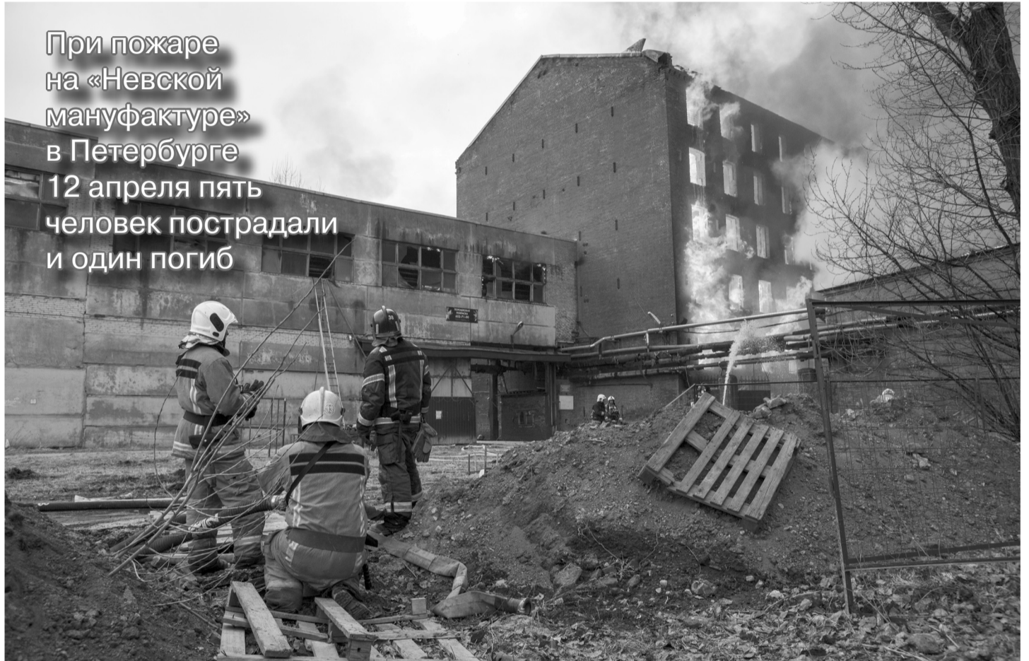
При пожаре на «Невской мануфактуре» в Петербурге 12 апреля пять человек пострадали и один погиб

Как сообщила 13 апреля пресс-служба Минздрава РФ, от огня и дыма пострадали пять человек. Из них двое пожарных: 30-летний заместитель начальника 64-й пожарно-спасательной части (доставлен в НИИ скорой помощи им. Джанелидзе) и 31-летний командир отделения 25-й пожарно-спасательной части (госпитализирован во Всероссийский центр экстренной и радиационной медицины имени А. М. Никифорова МЧС РФ). У обоих зафиксированы ожоги 40–50% тела, состояние тяжелое. В медцентр МЧС увезли еще двоих пострадавших работников