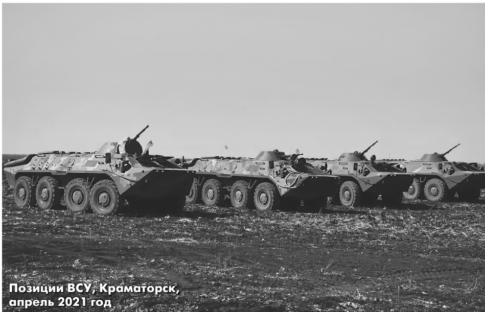
Позиции ВСУ, Краматорск, апрель 2021 год

Одновременно с формированием мощной группировки на северном (правом) фланге российский Генштаб усиливает левый фланг на юге. В Крым передислоцированы десантники 7-й гвардейской десантно-штурмовой горной дивизии ВДВ (7 гв. ДШД), где они отрабатывают парашютное десантирование с захватом и удержанием стратегического объекта (аэродрома) до подхода основных сил, а также высадку с моря с бронетехникой с больших десантных кораблей (БДК). В России наметился серьезный кризис с военной транспортной авиацией (ВТА). Основная рабочая лошадка ВТА ВКС — средний Ил-76МД — оснащена двигателями Д-30КП запорожского завода «Мотор Сич», которые больше не поставляются из-за войны и санкций. Новых Ил-76 с российским двигателем ПС-90А-76 за последние годы сделали всего несколько штук. По ходу сирийской операции самолеты ВТА нещадно использовали для переброски на Хмеймим техники, припасов и чего угод-