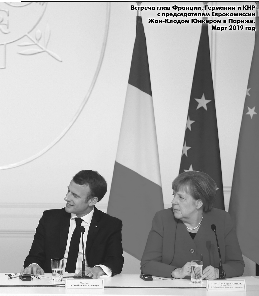
Встреча глав Франции, Германии и КНР с председателем Еврокомиссии Жан-Клодом Юнкером в Париже. Март 2019 год