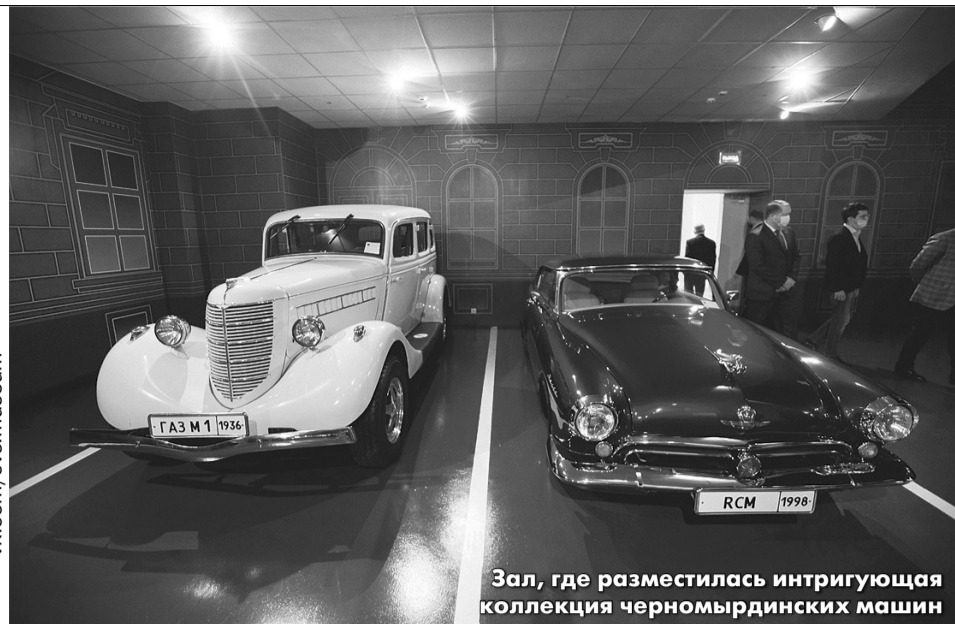
Зал, где разместилась интригующая коллекция черномырдинских машин

Он был мощным стабилизатором и в Киеве, и в Москве. При нем у радикальных сил по обе стороны не было бы шансов так разгуляться. Его фигура была гарантом спокойных отношений. Когда ему доложили, что у Украины большой долг за газ и надо бы надавить, он ответил: «Не надо. Отношения дороже денег». Правда, считается, что посла отозвали на родину после его интервью «Комсомольской правде», на которое обиделись украинские власти. Тем не менее когда Лужков в 2008 году призвал Россию выйти из Договора о дружбе с Украиной, чтобы поставить вопрос о ста-