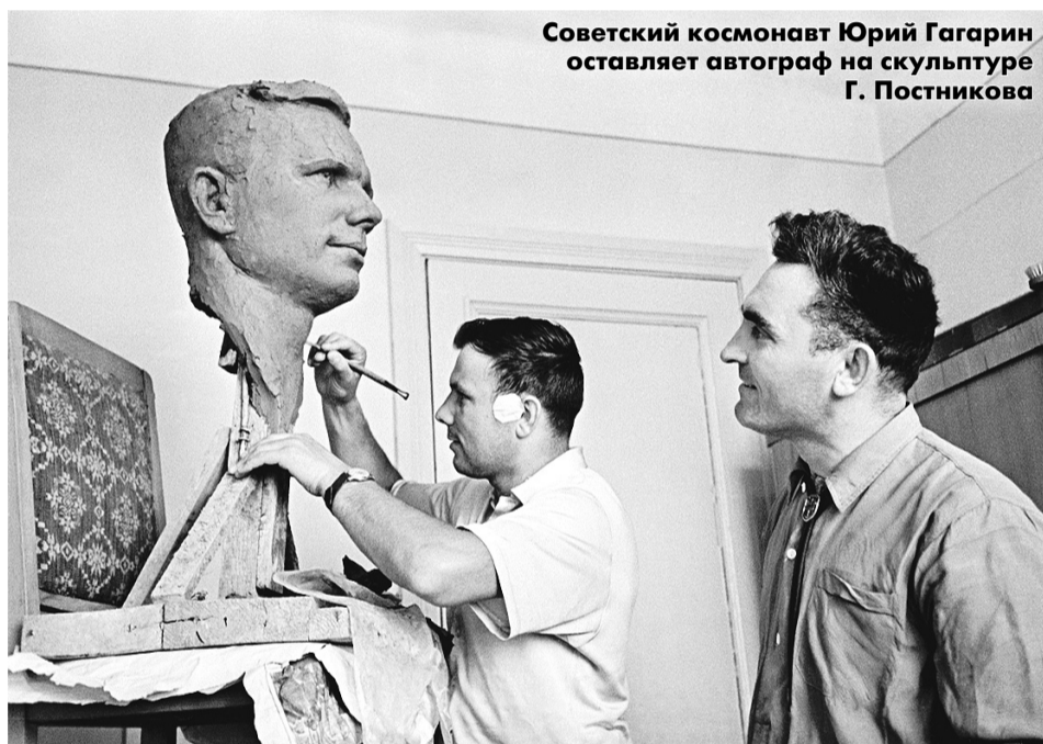
Советский космонавт Юрий Гагарин оставляет автограф на скульптуре Г. Постникова

«ОН РАЗДВИНУЛ, ПРЕДЕЛЫ ВОЗМОЖНОГО ДЛЯ НАС МГНОВЕННО. ЕСЛИ ГАГАРИН ТАМ, ТО И МЫ МОЖЕМ