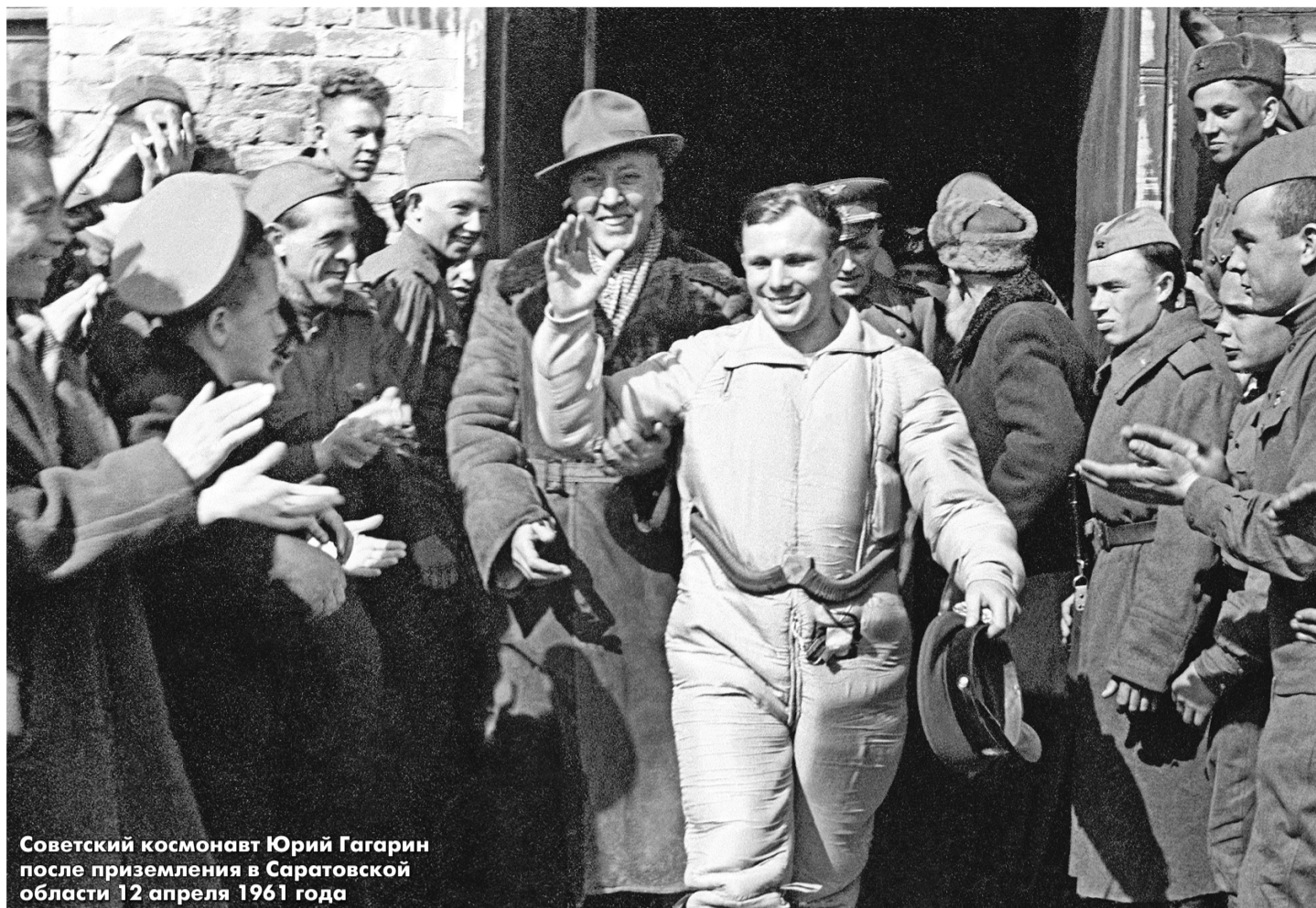
Советский космонавт Юрий Гагарин после приземления в Саратовской области 12 апреля 1961 года