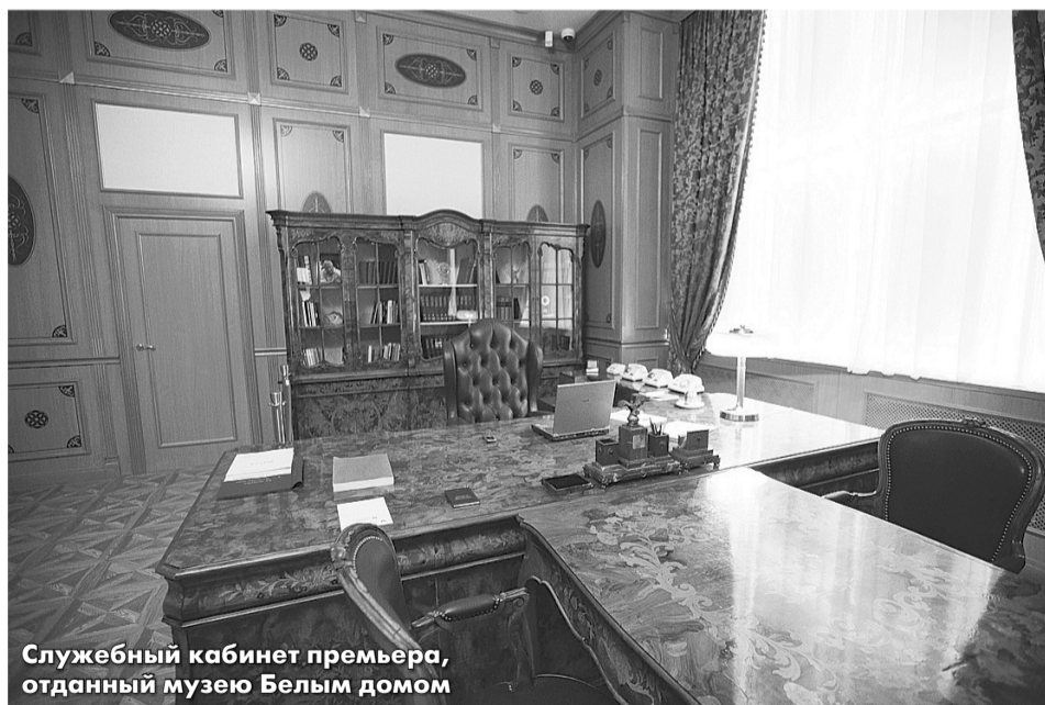
Служебный кабинет премьера, отданный музею Белым домом

фильмы, художественная коллекция или знаменитые «черномырдинки». В результате ты встречаешься не с бронзовым памятником, а с живым человеком, которого называли «ЧВС», «Степаныч», «народный премьер».